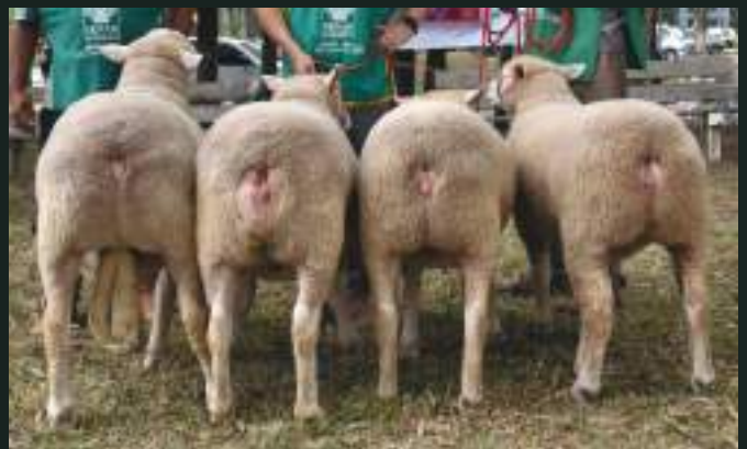
PRÊMIO PROGÊNIE DE PAI - São Paulino 1076 12º AGROVINO e XXVI FEOVELHA JM DA DIVISA 1086 JM DA DIVISA 1074B JM DA DIVISA 1170 JM DA DIVISA 1164