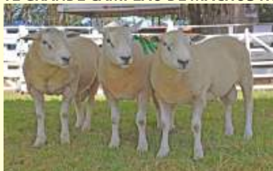
ACP BAÚ 1097 - ACP BAÚ 1098 - ACP BAÚ 1096 Lote Grande Campeão de Borregos Maiores