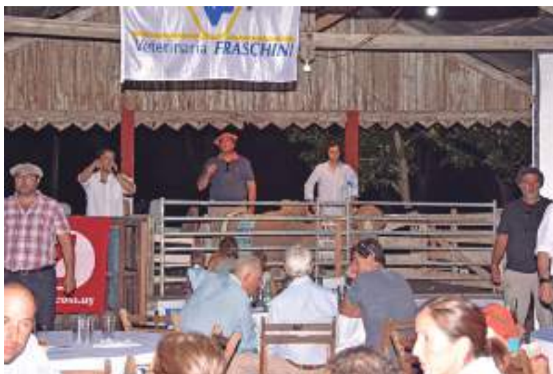
Vista de pista de vendas