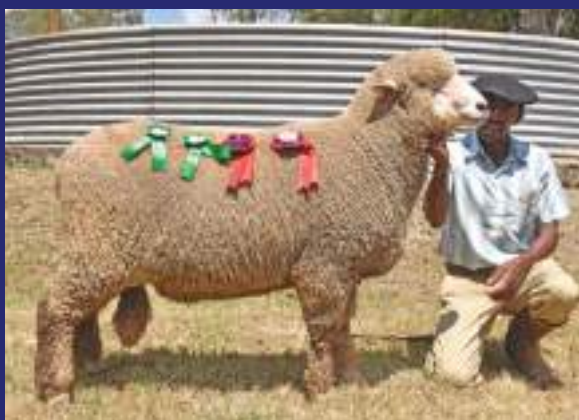
TELHO CHICO 62

Durante a abertura da Expodireto 2020, no início de março, na cidade de Não-Me-Toque, RS, os produtores de Jaguarão entregaram à ministra da agricultura, Tereza Cristina, um documento com reivindicações visando, especialmente, a abertura de outros mercados para a exportação de lãs. A denominada "Carta de Jaguarão", firmada pela cooperativa Mauá, com o apoio da ARCO, FARSUL, prefeitura de Jaguarão e Associação dos