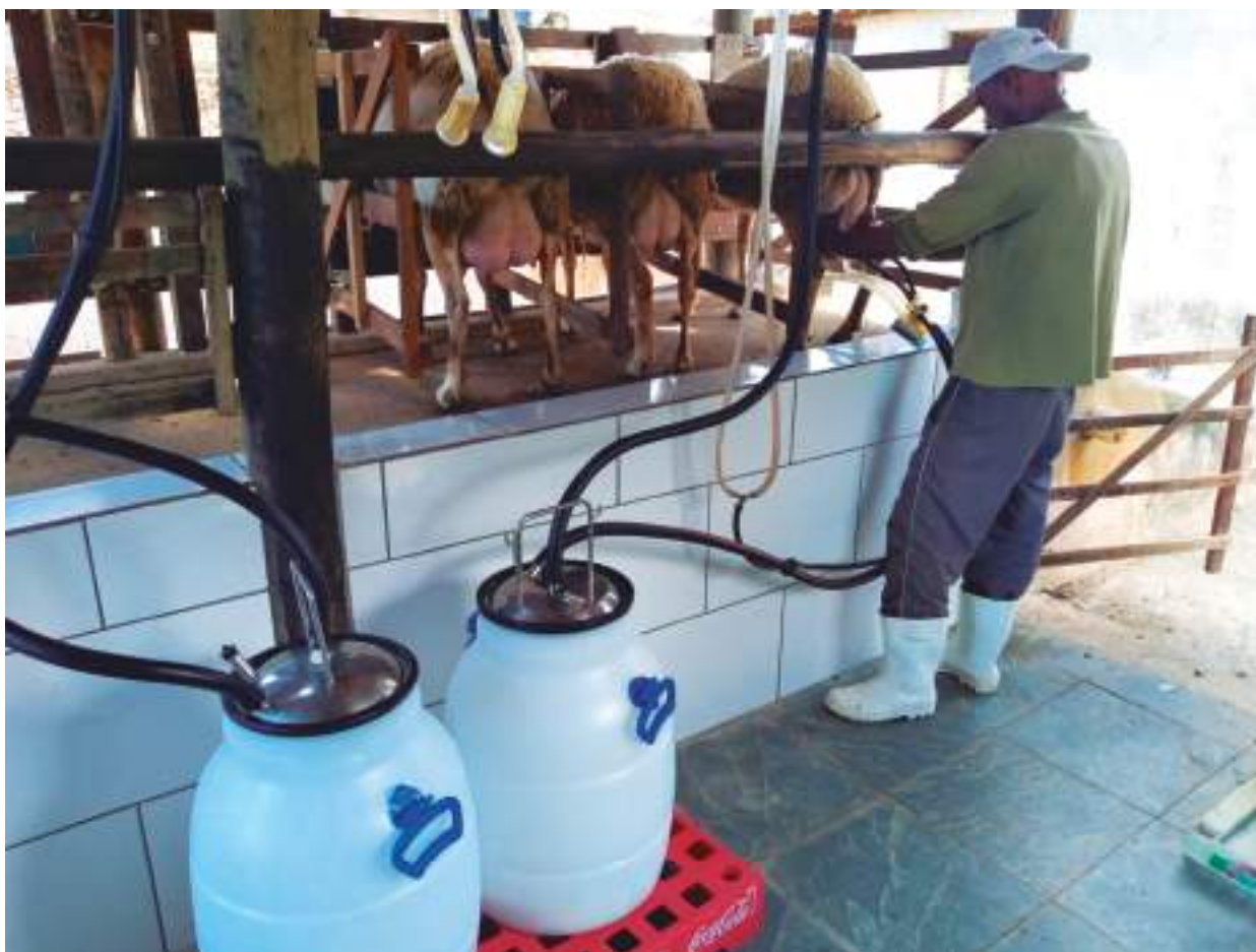
Nesta outra fazenda, também em Minas Gerais, outro exemplo de ordenha mais tecnificada

importante é encontrar qual o sistema que melhor se adequa a cada caso.