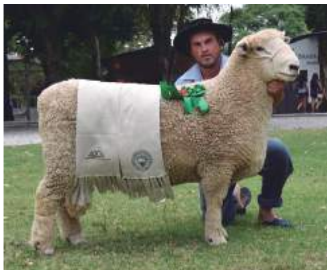
Campeão Romney Marsh