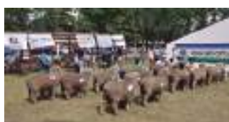
Expo feira de Melo, Uy, e a primeira Nacional do Corriedale