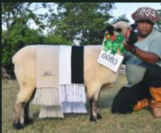
GRANDE CAMPEÃ PO 12º AGROVINO e XXVI FEOVELHA JM DA DIVISA HD 34 Nasc: 15/09/2018 Malbec 218 x Caçador 265