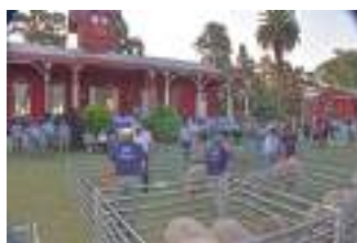
19º Dia do Merino no Uruguai