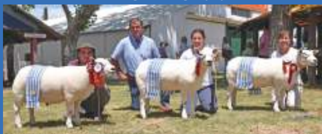
Tat. 86 Tat. 104 Tat. 666 GRAN CAMPEÓN P.I. GRAN CAMPEONA P.I. GRAN CAMPEONA P. de O.

Fiesta del Cordero Pesado de Sarandí del Yí 2019: LOTE CAMPEÓN DE CORDEROS EN PIE Expo Nacional de la Raza en San José: GRAN CAMPEÓN P.I. y GRAN CAMPEONA P. de O. Expo Durazno: GRAN CAMPEÓN y RDA GRAN CAMPEONA P. de O., RDO GRAN CAMPEÓN y RDA GRAN CAMPEONA P.I.