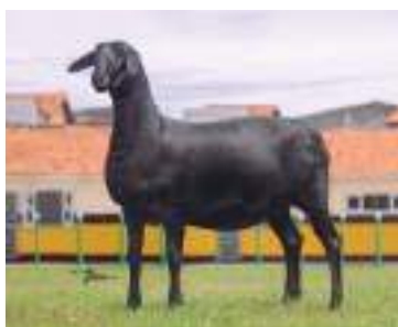
3º Melhor Fêmea O.P 654 Criação e exposição: Francisco Das Chagas / Francisco Oliveira Alves