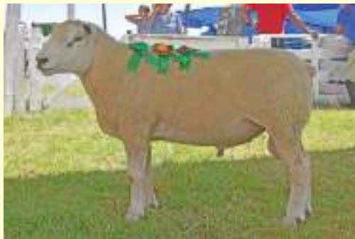
ACP BAÚ 1098