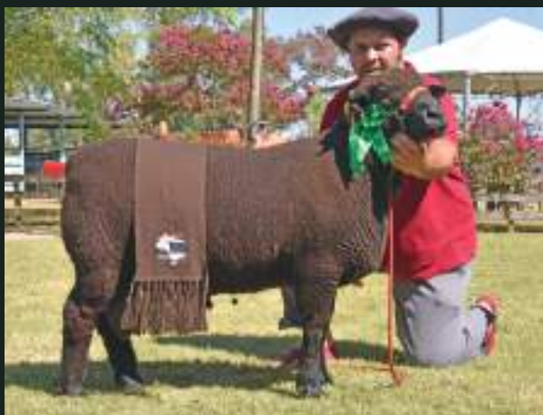
CAMPEÃO NC-C 47ª EXPOFEIRA DE JAGUARÃO JM DA DIVISA NC 68 Nasc: 02/05/2018 Deleboca NC 17x JM da Divisa NC 1031