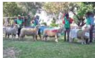
Quatro melhores machos da exposição