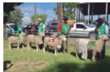
Quatro melhores fêmeas da exposição