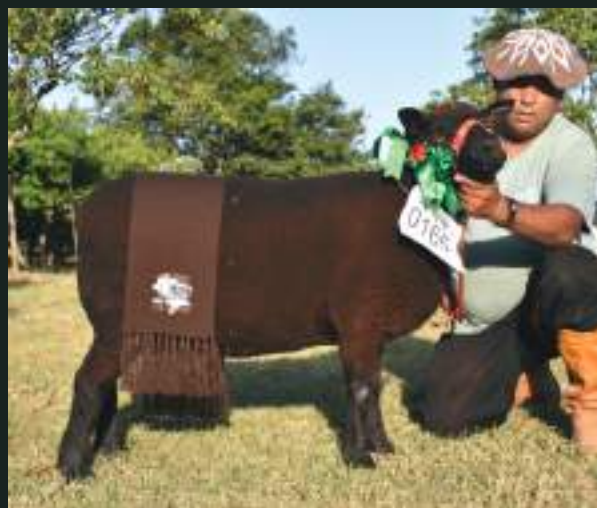
CAMPEÃ NC-C XXXVI FEOVELHA JM DA DIVISA NC 63 Nasc: 03/05/2018 Deleboca NC 3 x JM da Divisa NC 12