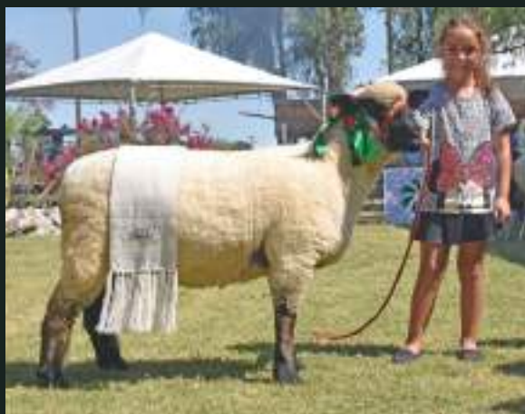
GRANDE CAMPEÃ PO 47ª EXPOFEIRA DE JAGUARÃO JM DA DIVISA 18 Nasc: 06/08/2018 Dom Rosa 170 x Caçador 323