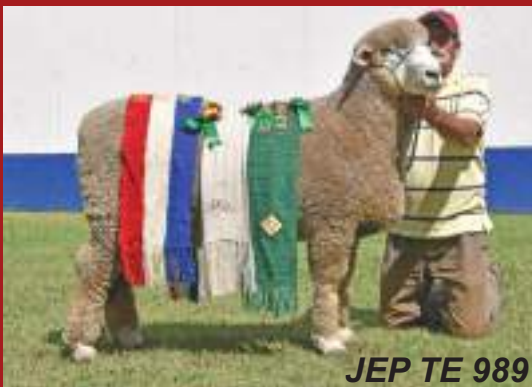
JEP TE 989