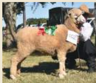
Reservada Grande Campeã 36ª Feovelha Coxilha Verde 2192