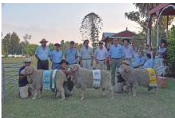
Os três exemplares vencedores, da esquerda para a direita: Melhor animal, Segundo Melhor Animal e Terceiro Melhor, junto com os jurados e proprietários

criadores de Merino, que prestigiam a nossa revista com seus anúncios, fazendo esta integração cada vez mais forte entre ovinocultores brasileiros e uruguaios.