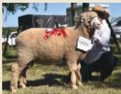
Reservado Grande Campeão 36ª Feovelha Coxilha Verde 1999