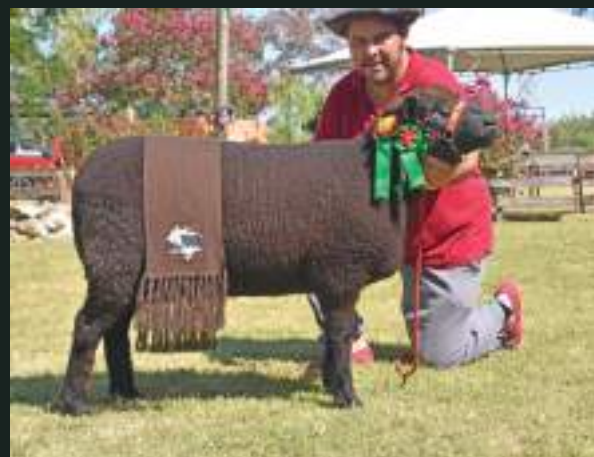
CAMPEÃ NC-C 47ª EXPOFEIRA DE JAGUARÃO JM DA DIVISA NC 62 Nasc: 25/04/2018 Deleboca NC 3x JM da Divisa NC 15