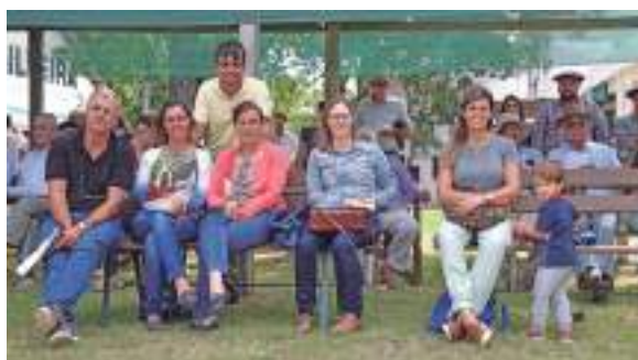
Grupo de corriedalistas brasileiros presentes