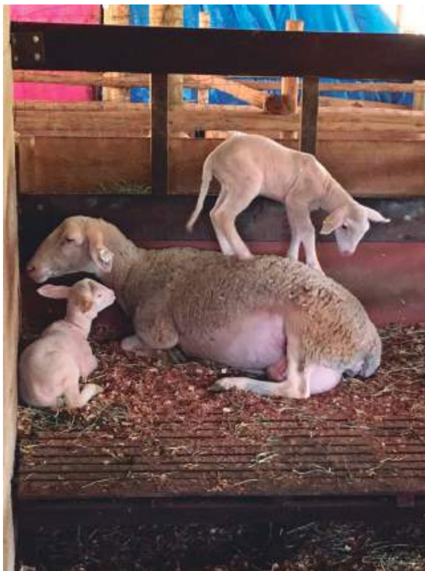
Rebanho da Fazenda da Ovelha