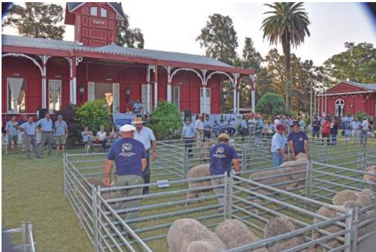
Vista geral dos jurados

A Revista ARCO esteve presente no 19º Dia do Merino que aconteceu em este ano em Paysandu, Uruguai. A proximidade do Estado do Rio Grande do Sul com o vizinho País faz com os criadores de ovinos do sul do Brasil estejam sempre fazendo intercambio de atividades com os uruguaios, neste caso com os criadores de Merino Australiano e suas variedades.