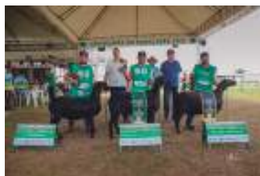
Grande campeonato fêmeas da raça