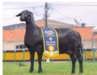
Grande Campeã da Raça CATIVA ATIVA TE 92 Criação e exposição: Cativa Agroindústria Ltda