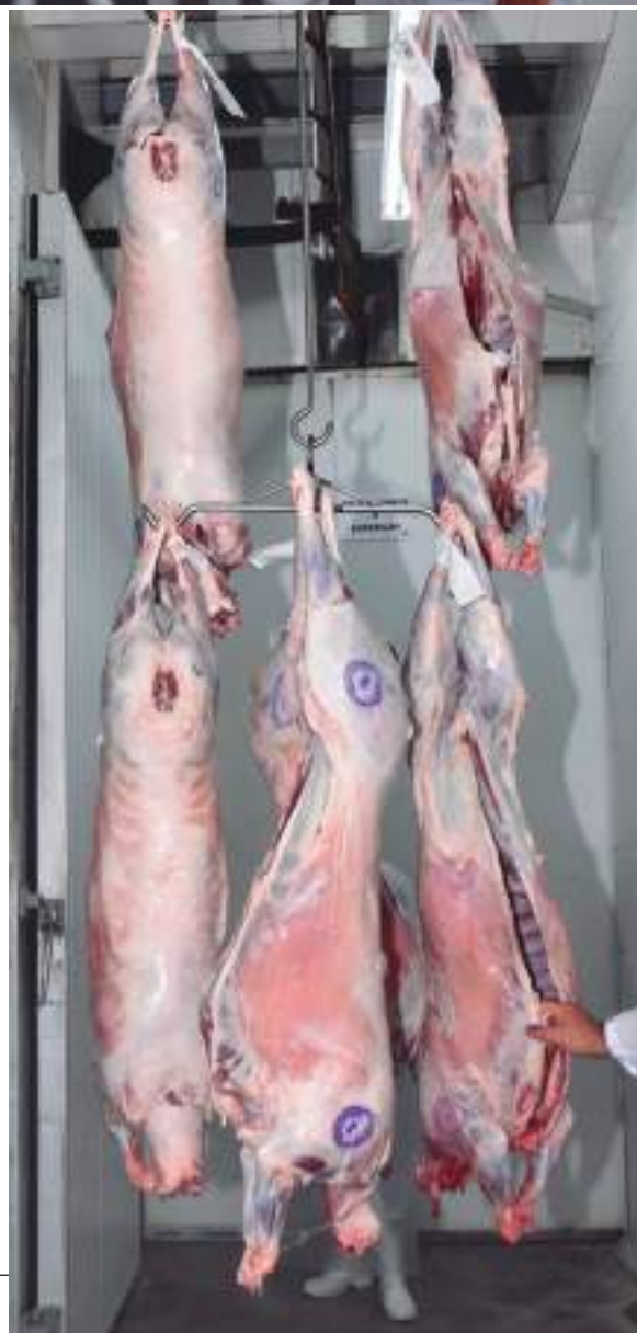
Exemplos de carcaças correspondentes