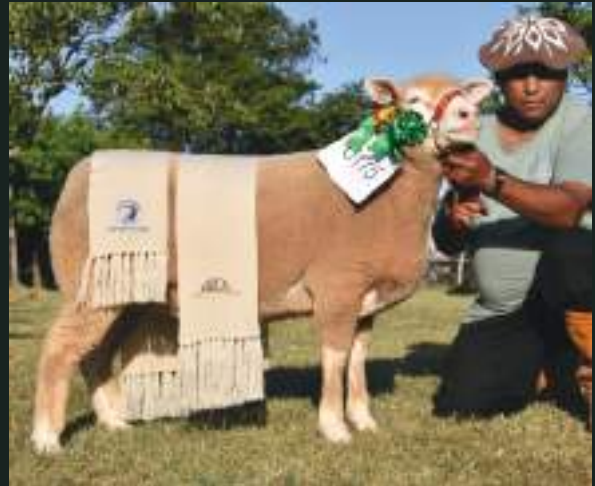
GRANDE CAMPEÃ PO 12º AGROVINO e XXXVI FEOVELHA JM DA DIVISA 1164 Nasc: 05/05/2018 São Paulino 1076 x JM da Divisa 1014