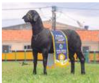
Grande campeão do futuro