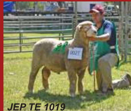
JEP TE 1019

36ª FEOVELHA - Grande Campeã e Grande Campeão PO