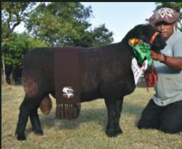
CAMPEÃO NC-C XXXVI FEOVELHA JM DA DIVISA NC 61 Nasc: 05/05/2018 Deleboca NC 3 x JM da Divisa NC 08