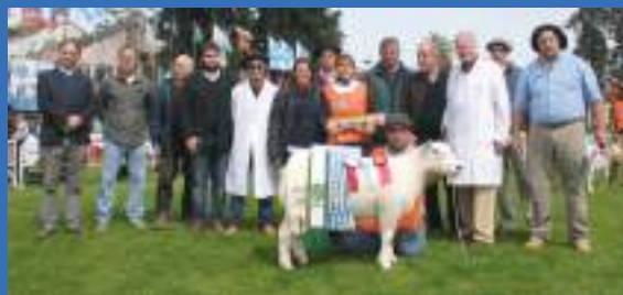
Tat. 609 GRAN CAMPEÓN P. de O.