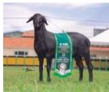
Res. Grande campeão do futuro