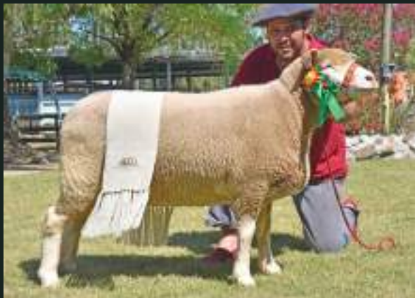
GRANDE CAMPEÃ PO 47º EXPOFEIRA DE JAGUARÃO JM DA DIVISA 1086 Nasc: 18/05/2017 São Paulino 1076 x Padrão MA I 101