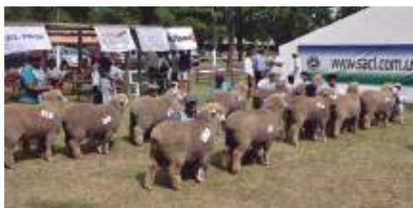
Jurados com expressiva fila de animais