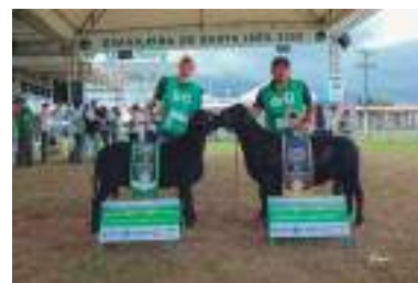
Grande campeonato machos da raça