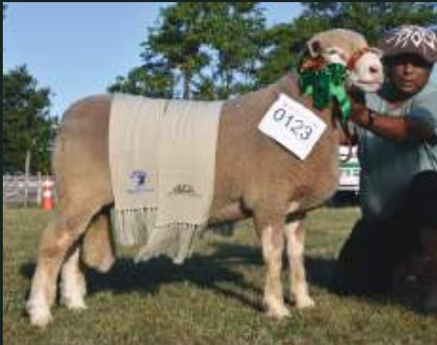
GRANDE CAMPEÃO PO 12º AGROVINO e XXXVI FEOVELHA JM DA DIVISA 1074B Nasc: 27/04/2018 São Paulino 1076 x Luísinha 797