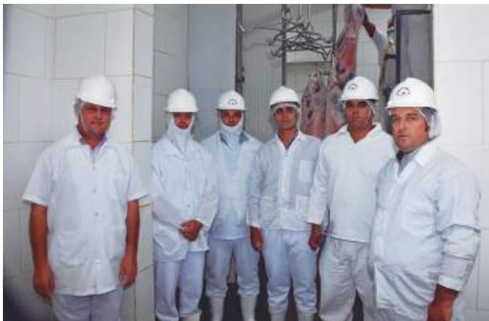
Jurados, criadores e membros da ABCOC acompanhando o abate no Frigorífico Producarne

constatado no momento seguinte, em que os cordeiros foram para o frigorífico e abatidos, sendo então avaliados quanto à conformação, peso, qualidade e acabamento de carcaças. Assim, os cordeiros Crioulos surpreenderam de forma positiva por terem carcaças extremamente bem conformadas, com peso